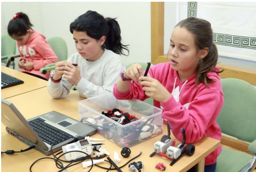
Das niñas participan en un campamento tecnológico este verano.

Según datos de la RAI, el porcentaje actual de mujeres en escuelas politécnicas raramente supera el 25 por ciento.