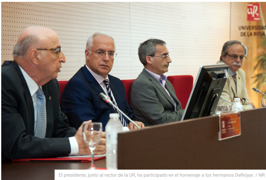
El presidente, junto al rector de la UR, ha participado en el homenaje a los hermanos Delhúyar. / NR